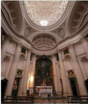
Borromini Igreja de San Carlo alle Quattro Fontane, 1634, Roma,

Em forma de elipse, a praça é cercada por duas grandes colonatas cobertas. Elas se estendem em curva tanto para a esquerda como para a direita, mas estão ligadas em linha reta aos dois extremos da fachada da igreja.