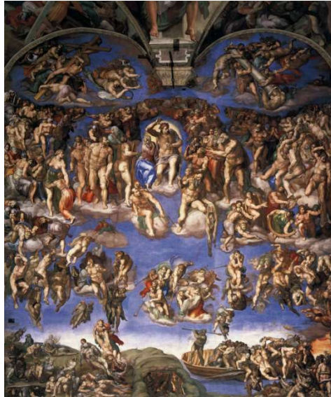
O Juízo Final 1536-1541, de Michelangelo. Capela Sistina, Vaticano.