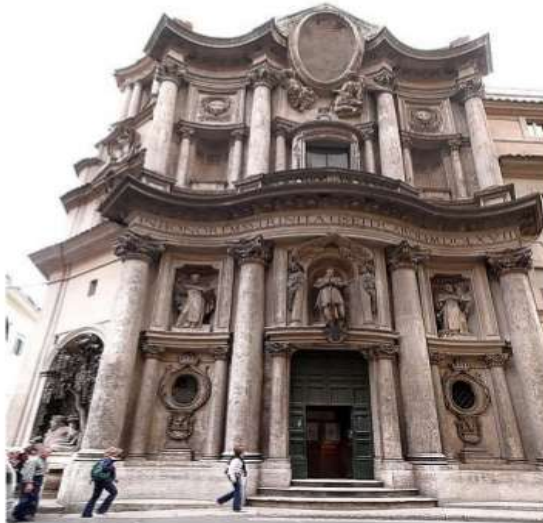
Igreja São Carlos das 4 Fontes, 1634, Roma (Itália).

Palácios: Integrados na paisagem e no espaço envolvente – jardins, Planta em “U” ou duplo “U”.