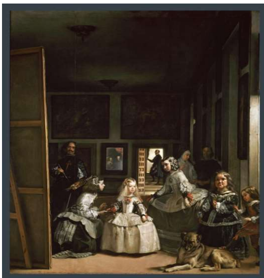
As meninas, 1656, Diego Velázquez.

Entre os retratos de pessoas da corte está “As meninas”, considerada uma das obras-primas de Velázquez. A tela mostra uma composição muito interessante, que transmite ao observador a sensação de profundidade da sala onde se passa a cena e revela um jogo de luz e sombra.