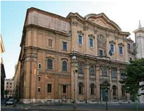
Oratório dos Filipinos, Roma, 1637-1667, Borromini

Palácios: Integrados na paisagem e no espaço envolvente – jardins, Planta em “U” ou duplo “U”.