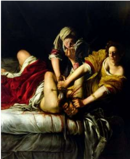
Judite degolando Holofernes, 1620, Artemisia Gentileschi.

Iluminação dramática; Uma história do Antigo Testamento.