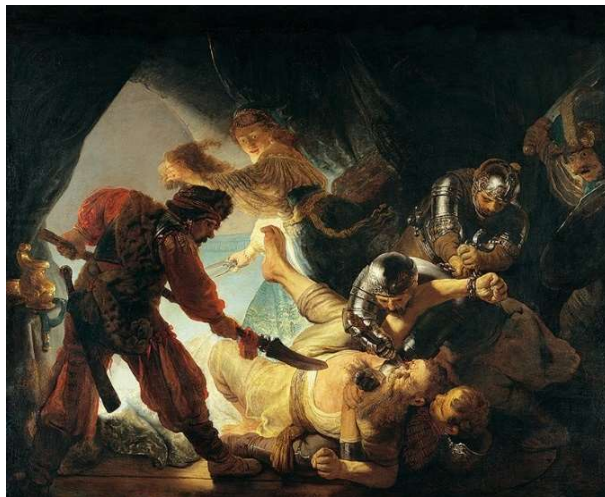
A captura de Sansão, 1636, Rembrandt.