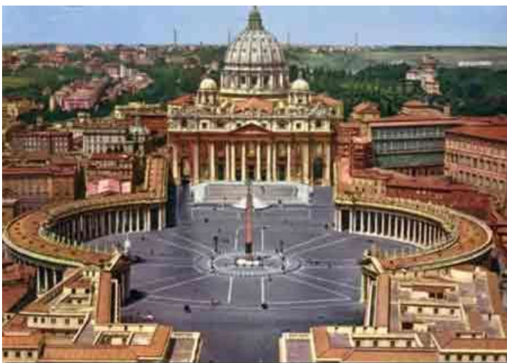
Praça de São Pedro, no Vaticano, 1657-1666, projetada por Bernini

Nesse período foi destacado a importância da beleza do espaço situado em torno da obra arquitetônica. Com isso, houve uma preocupação com os projetos da praça das igrejas como por exemplo: Basílica de São Pedro, no Vaticano. Um dos exemplos mais significativos da arquitetura e do urbanismo do século XVII na Itália.