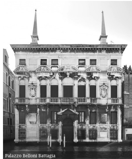
Palazzo Belloni Battagia