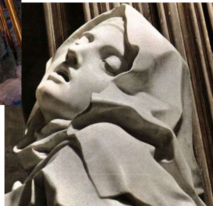
Êxtase de Santa Teresa 1645-1652, de Bernini.