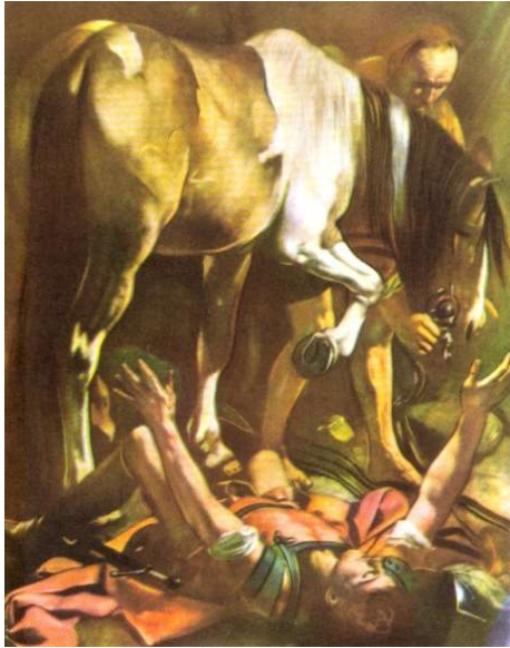
A conversão de São Paulo, 1600-1601, Caravaggio.

“A pintura criou uma polêmica quando exibida pela primeira vez , pois a representação realista do tema religioso foi vista como grosseira e inadequada.”