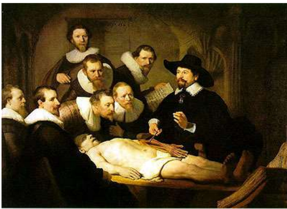
A Lição de Anatomia do Doutor Tulp, 1632, de Rembrandt.

É assim, por exemplo, na tela A Lição de Anatomia do Doutor Tulp, Rembrandt parece surpreender o professor e os estudiosos em plena atividade de dissecação. Se observarmos bem esse quadro, podemos notar que foi o trabalho do pintor com a penumbra- que indefine os espaços- e o uso que fez da luz- intensa no corpo do cadáver e amenizada nos rostos atentos e curiosos dos ouvintes - que estabelece o clima de descoberta e de pesquisa que a cena representa.